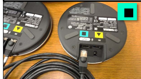
⑥マイクにマイクケーブルを接続