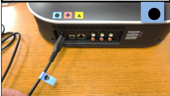
①本体にPowerケーブルを接続