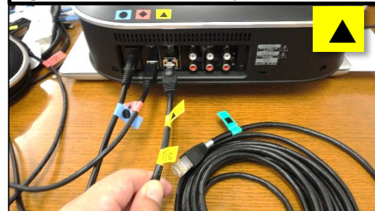
③本体にMicケーブルを接続