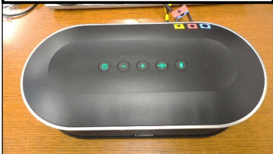
⑦本体電源をONにする。ランプがグリーンになる