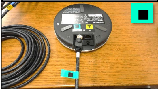
④マイクにマイクケーブルを接続