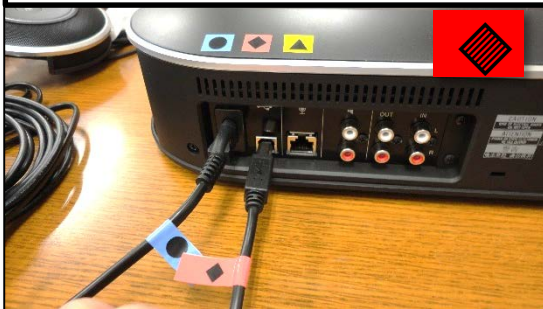
②本体にUSBケーブルを接続。反対側はPCへ